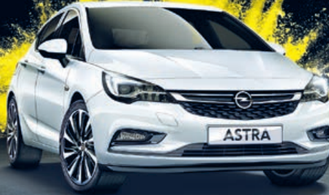
Abb. zeigen Sonderausstattungen.