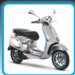
Vespa Elettrica Der Klassiker mit hochmoderner Technik