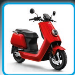
NIU N1S Der Preiswerte Bestseller ab 2.899,- €

JETZT PROBEFAHRT VEREINBAREN UND ELEKTRO-MOBILITÄT ERLEBEN