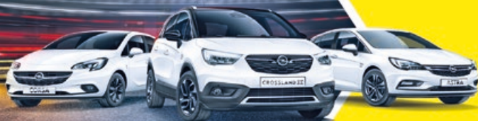
Abb. zeigen Sonderausstattungen.